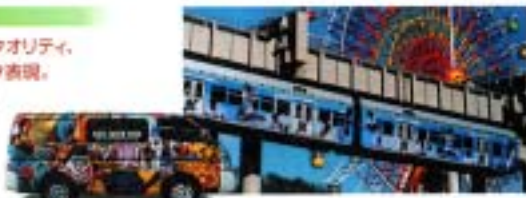
オーディエンス SP4000 | SP4114