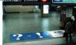
商品紹介... (Small text describing the product)