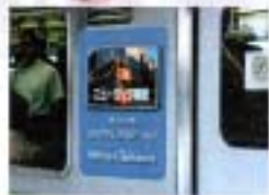
アドバンスドグラフィックス SP4000 | SP4114